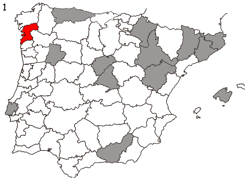
Fig. 1.- Distribución iberoibaleaar de Tasgius (Tasgius) pedator (Gravenhorst, 1802) según Prieto Manzanares (2018), Gamarra & Outerelo (2022) y Outerelo et al. (2025). En rojo, la nueva cita para Galicia presentada en este trabajo.

Vogel, J. 1989. Familie Staphylinidae , pp. 213-440. In: Koch, K. (ed.). Die Käfer Mitteleuropas. Ökologie 1 . Goecke & Evers. Krefeld, 382 pp.