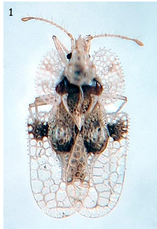
Fig. 1.- Habitus de Corythucha arcuata (Say), Mandelos, Cequeliños (Arbo), 28/12/2024.

Los datos que aportamos confirman la presencia en Galicia de una segunda especie del género Corythucha Stål, 1873, en este caso C. arcuata , y constituyen las localidades más noroccidentales ibéricas conocidas para esta especie. La distancia entre las localidades de Galicia y Portugal, y las nororientales ibéricas de Guipúzcoa y Lleida sugieren, como en otros casos de especies invasoras, la concurrencia de vías diversas de penetración y expansión en la Península, como ya fue expuesto por Rabitsch (2010). En un estudio reciente, Ciceu et al. (2024) presentan un mapa de distribución potencial en el que se contempla que en un futuro próximo esta especie se expandirá con mayor facilidad por la Europa septentrional como consecuencia del cambio climático. De todos modos, dado el alto potencial invasor de esta especie, es probable que su expansión en Galicia sea notable en los próximos años, donde encontrará condiciones excepcionales para su establecimiento, al igual que su congénere Corythucha ciliata (Say, 1832), detectada por primera vez en 1994 (Rodríguez Gracia, 1994) y ampliamente extendida ya por las cuatro provincias gallegas (Valcárcel et al., 2023).