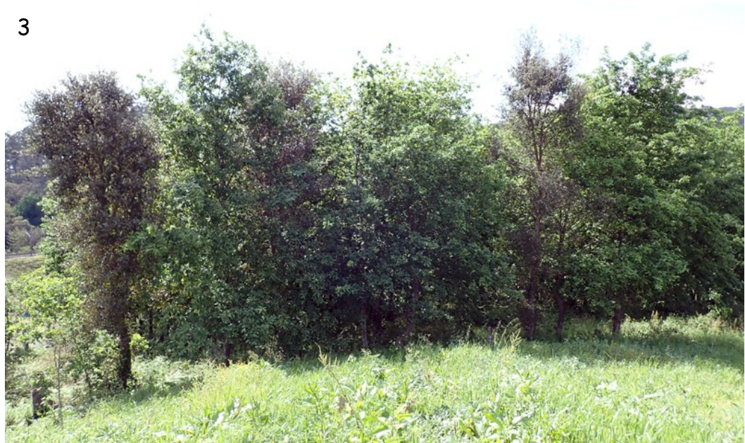
Fig. 2.- Ejemplares de Corythucha arcuata (Say), en Mandelos, Cequeliños (Arbo), 13/04/2025. 2a.- En el envés de hojas de castaño. 2b.- En el envés de hojas de roble. Fig. 3.- Vista de la parcela.