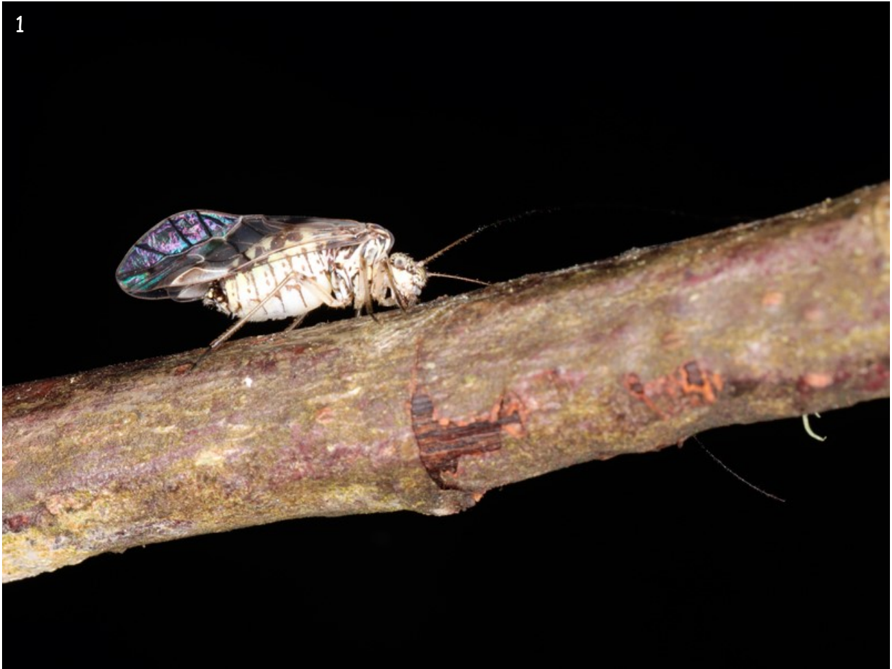
Fig. 1.- A view of the specimen of Psococerastis gibbosa (Sulzer, 1776) collected in Paredes de Coura (Viana do Castelo, Portugal) on 17/07/2024.