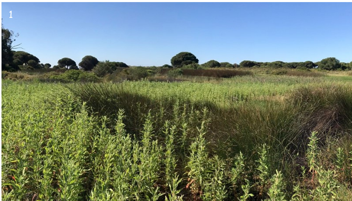
Fig. 1. - Vista general del hábitat en las Turberas del Lancón, Paraje Natural Marismas del Río Piedras y Flecha del Rompido, El Rompido, Cartaya (Huelva), 1-V-24.