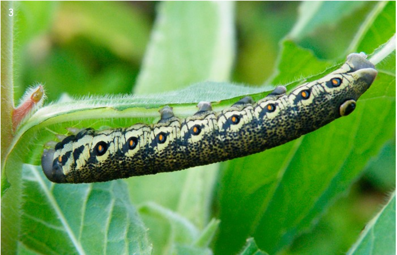
Fig. 3. - Larva L5 de P. proserpina , El Rompido, Cartaya (Huelva), 3/V/2024.