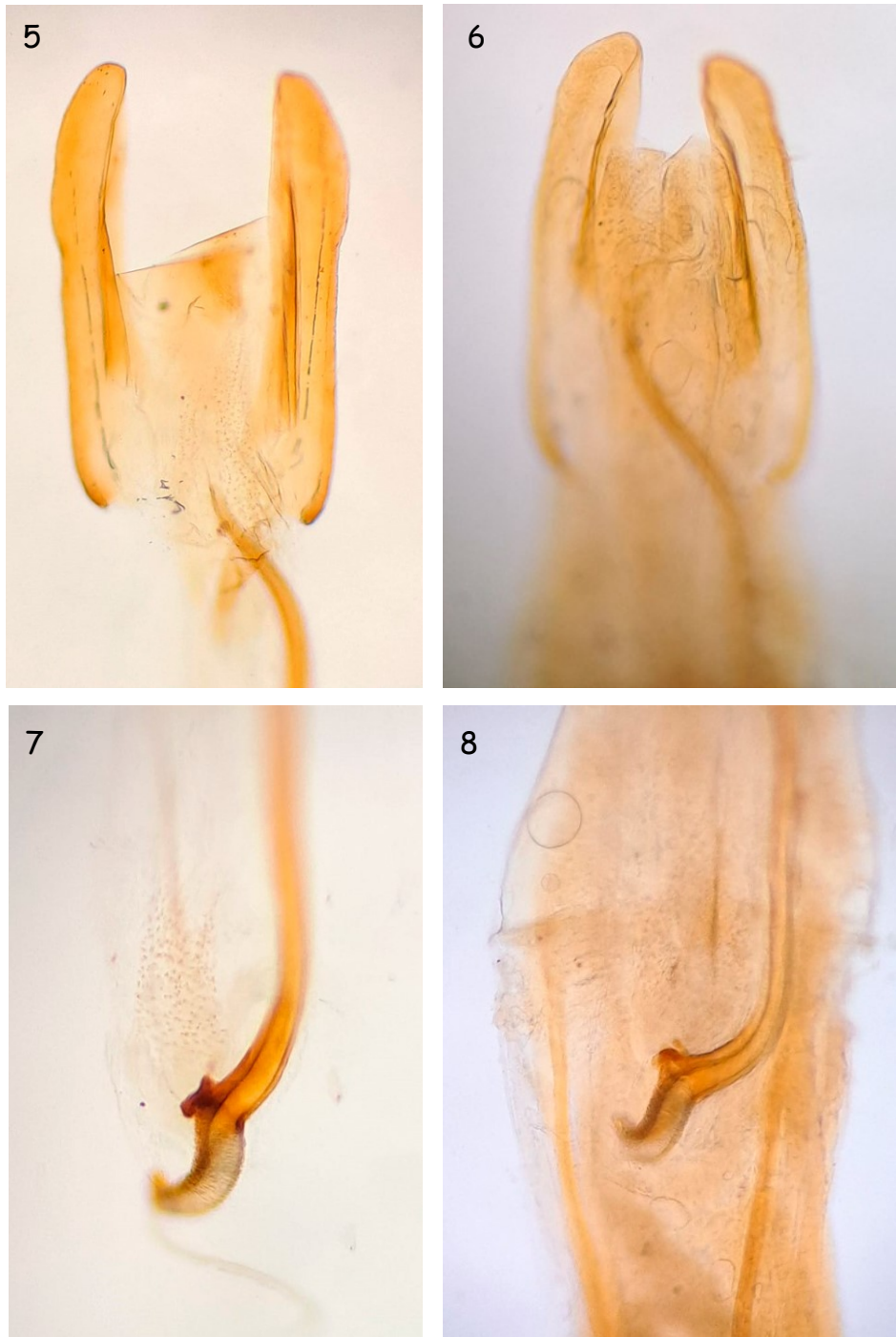
Figs. 5-8.- Comparación de diversos caracteres entre machos de Forficula iberica de Dine (Bragança, Portugal) y F. lesnei de A Fonsagrada (Lugo, España).

5.- F. iberica : extremo del eedeago y metaparámetros. 6.- F. lesnei : extremo del eedeago y metaparámetros.