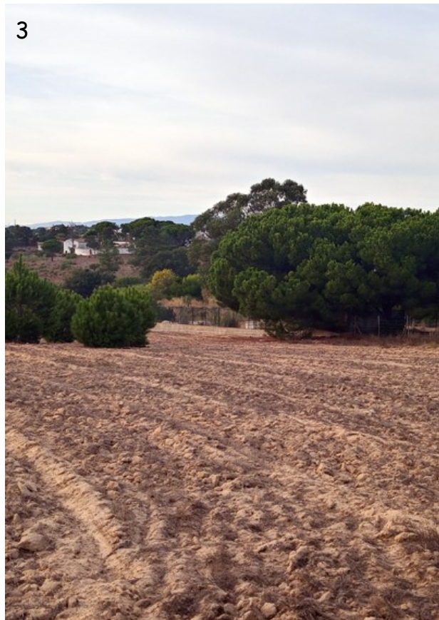
Figs. 2-3.- Caramujeira (Lagoa), 18/10/2021. 2.- Vista del pinar. 3.- Terrenos colindantes recién roturados. Al fondo, la Serra de Monchique. (Fotos: F. Prieto).