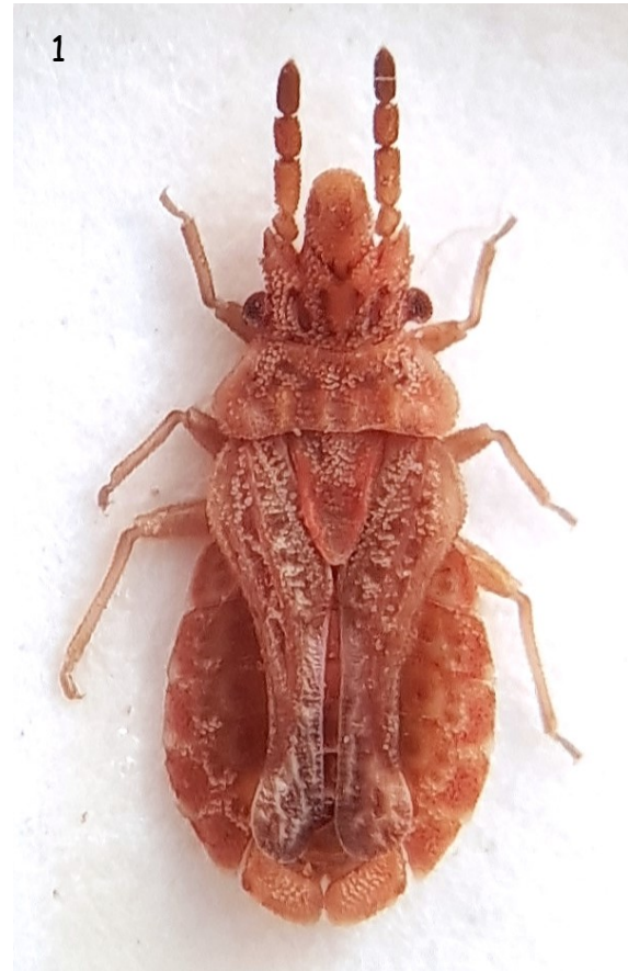
Fig. 1.- Macho estenóptero de Aradus (A.) cinnamomeus Panzer, 1806, de Caramujeira (Lagoa), el 17/10/2021. (Foto: J.P. Valcárcel).