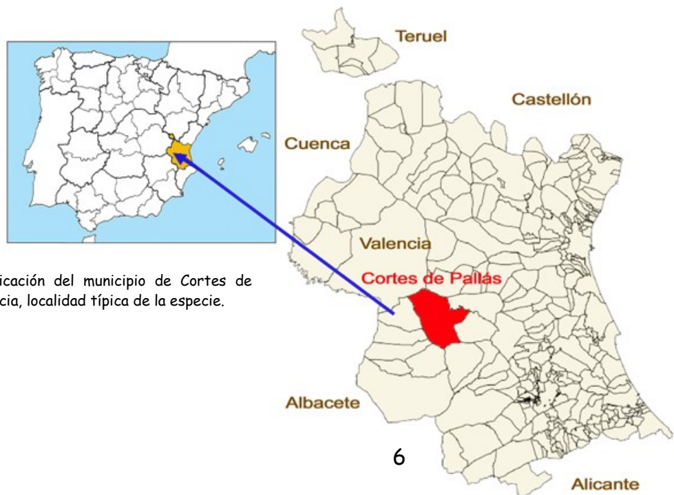
Fig. 6.- Mapa con indicación del municipio de Cortes de Pallás, provincia de Valencia, localidad típica de la especie.