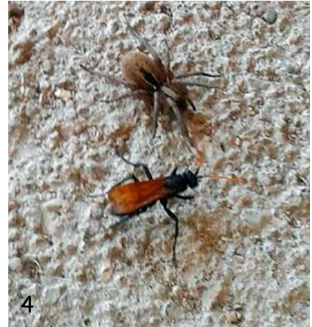
Fig. 4.- Fotografía de Entypus unifasciatus dumosus (Spinola, 1851) acechando a Lycosa sp., sector urbano.