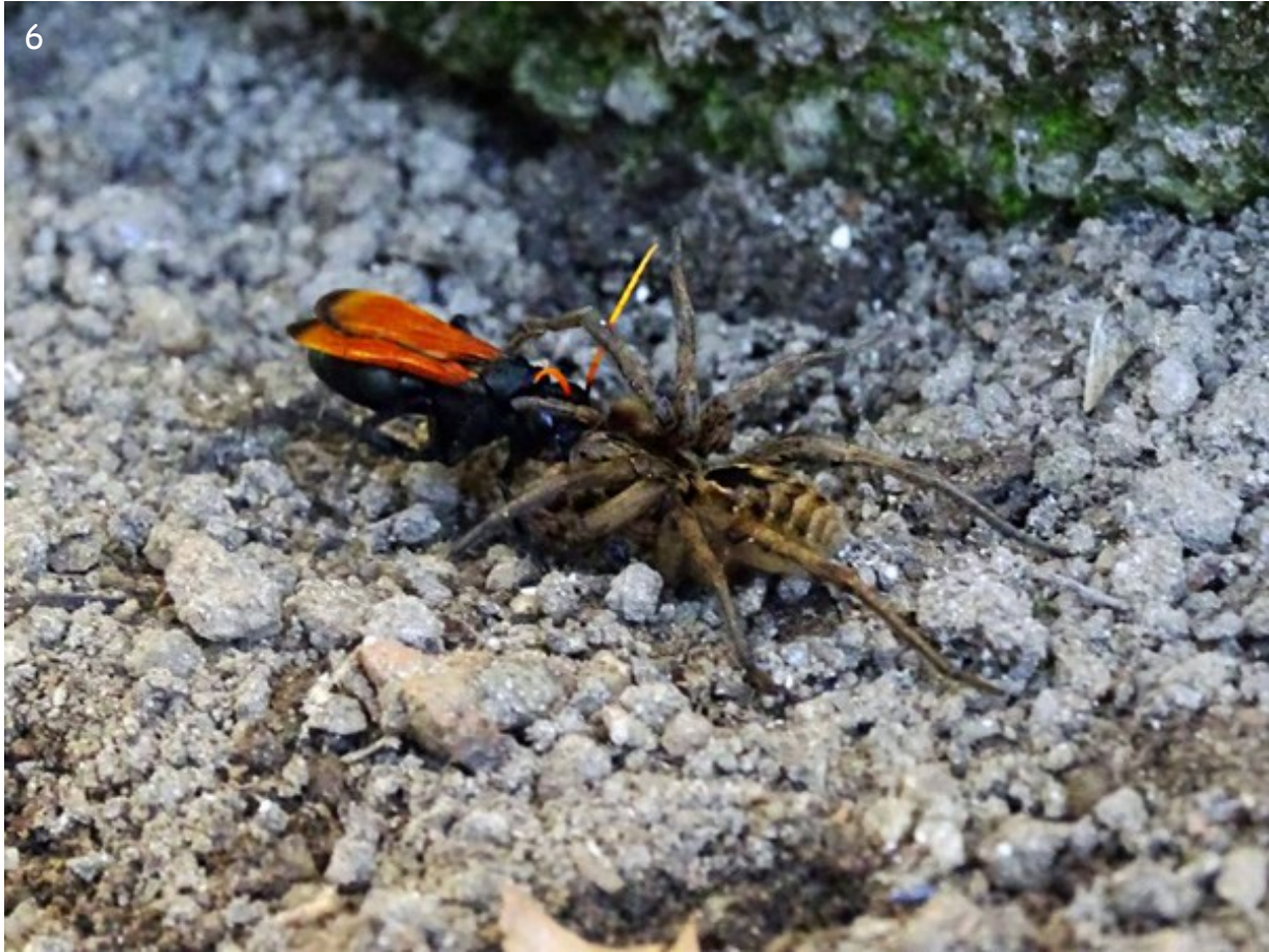
Fig. 6.- Fotografía de Entypus unifasciatus dumosus (Spinola, 1851) donde se observa arrastrando a Lycosa sp., sector periurbano.