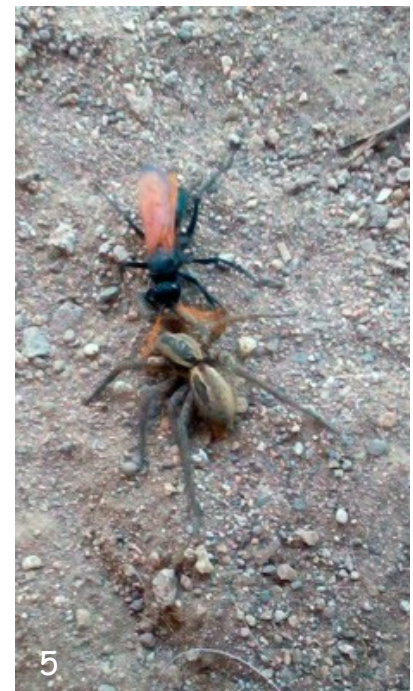
Fig. 5.- Fotografía de Entypus unifasciatus dumosus (Spinola, 1851) donde se observa arrastrando a Lycosa sp., sector urbano.