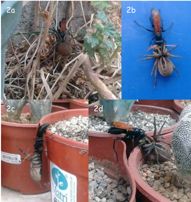
Fig. 2a-d.- Secuencia fotográfica en sector urbano de la Ciudad de Valparaíso. Se observa el arrastre de Lycosa sp. por Entypus unifasciatus dumosus (Spinola, 1851) en superficies horizontales y verticales.