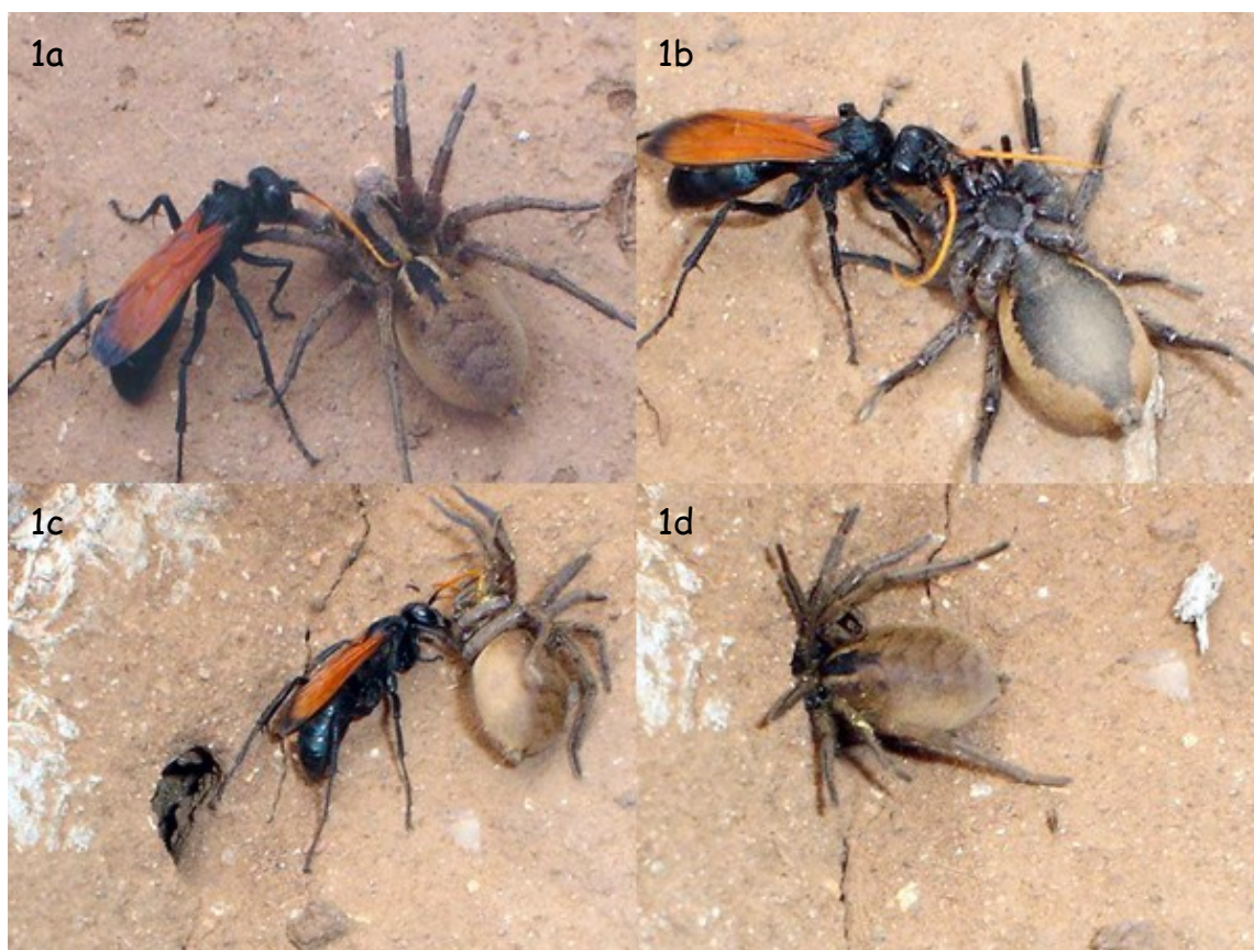
Fig. 1a-d. - Secuencia fotográfica de caza de Lycosa sp. por Entypus unifasciatus dumosus (Spinola, 1851) realizado en sector urbano de la ciudad de Viña del Mar. Se observa el arrastre y guardado en nidificación.